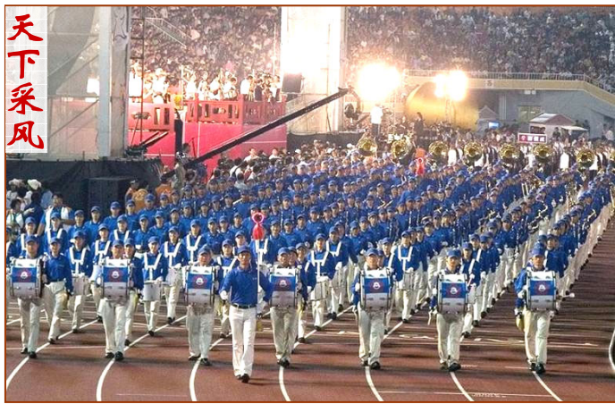
▲十月二十日晚，台湾全运会开幕典礼上，法轮功学员的天国乐团引领各县市选手进场，赢得热烈喝彩。