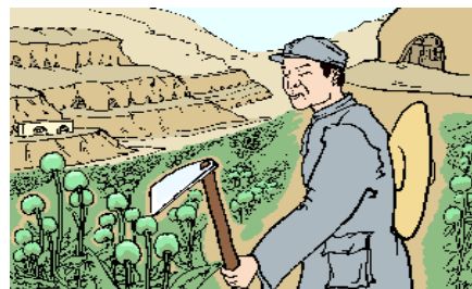
大生产运动，种植罂粟，制造鸦片

陆续被揭穿，以及《九评共产党》的问世，人们越来越看清了中共的邪恶，觉醒的百姓纷纷顺应天意，退出党、团、队，保平安。在此善劝父老乡亲们：赶快了解真相。特别是那些为眼前名利跟着邪党迫害善良的人，当天灭中共、大难来临时，再说“是共产党让我干的”，就晚了。