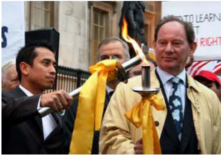
英国伦敦人权圣火传递仪式

【明慧网】人权圣火传递活动是由全球三百多名政要、医生、律师等组成的“法轮功受迫害真相联合调查团”发起，在全球巡回传递，目的是呼吁国际社会关注中国恶劣的人权状况、尤其是中共对法轮功的迫害，拒绝让象征人类和平自由的奥运变成中共实行独裁和镇压的“血腥奥运”。人权圣火于八月九日在希腊点燃，至今已途经十八个国家的二十五个城市。零七年十月二十五日，人权圣火全球传递活动抵达英国伦敦。