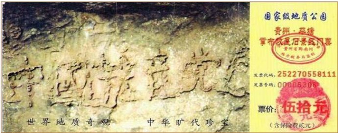
▲掌布风景区门票上“中国共产党亡”的照片

二零零二年六月，在贵州平塘县发现的亿年“藏字石”（下图），五百年前崩裂惊现“中国共产党亡”。这一切其实都是在告诉人们“天灭中共”的天象，希望人们能够“退党保平安”。