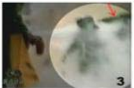
3. 뒷머리에 닿아있는 물체