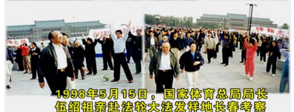
1998年5月15日，国家体育总局局长伍绍祖亲赴法轮大法发祥地长春考察