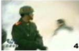
4. 타격자세를 유지한 타격자