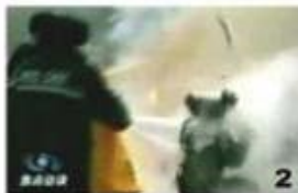
2. 때리고 뿔겨나는 물체