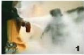
1. 류의 머리에 강타