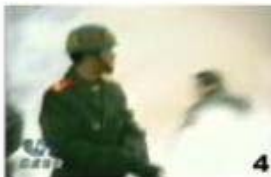
4. 타격자세를 유지한 타격자