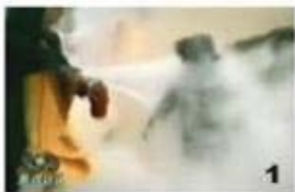
1. 류의 머리에 강타