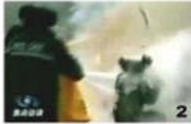
2. 때리고 뿔겨나는 물체