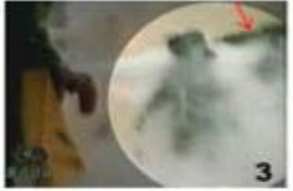
3. 뒷머리에 닿아있는 물체