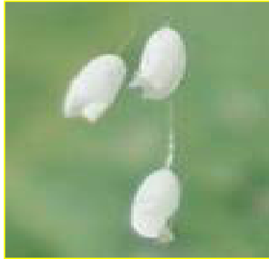
优昙婆罗花放大图

今天正处在一个新旧交替的时代，人世间的一切变化都与今天正在发生的一件大事有关，而“优昙婆罗花”的盛开预示着法轮大法在世间的洪传，这是人间的盛事，祥瑞的兆头。在中共恶党利用谎言、暴力等卑鄙手段，残酷迫害信仰真、善、忍的法轮大法修炼者，同时大法修炼者又讲清真相救度世人的今天，我们每个人是否也将要面临着正与邪，生与死的选择？