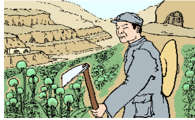
大生产运动，种植罂粟，制造鸦片

当今中共为了迫害法轮功，同样用卑鄙的手段造了很多谣言。随着“天安门自焚”等假案陆续被揭穿，