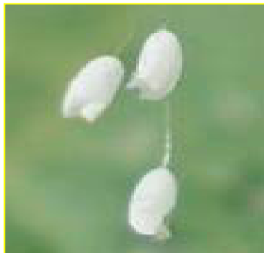
优昙婆罗花放大图

今天正处在一个新旧交替的时代，人世间的一切变化都与今天正在发生的一件大事有关，而“优昙婆罗花”的盛开预示着法轮大法在世间的洪传，这是人间的盛事，祥瑞的兆头。在中共恶党利用谎言、暴力等卑鄙手段，残酷迫害信仰真、善、忍的法轮大法修炼者，同时大法修炼者又讲清真相救度世人的今天，我们每个人是否也将要面临着正与邪，生与死的选择？