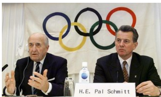
国际奥委会副主席、匈牙利奥委会主席 鲍尔·施密特先生（右）

【大纪元 11月29日讯】国际奥委会资深委员、欧洲议会议员，也是1968年及1972年击剑金牌得主匈牙利籍的鲍尔·施密特先生日前