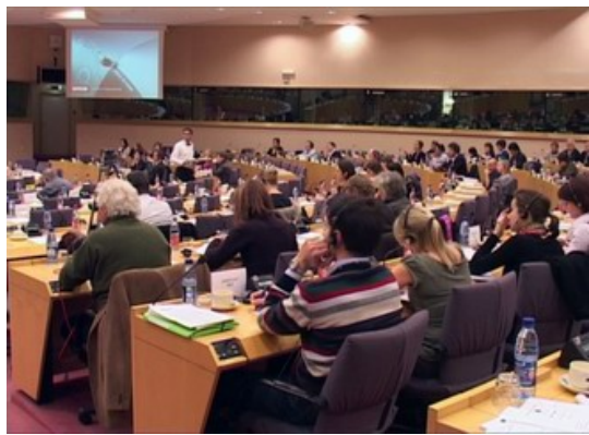
欧洲议会在布鲁塞尔举行中国人权听证

【明慧网】欧洲议会二零零七年十一月二十六日下午在布鲁塞尔举行中国人权听证。听证会由欧议会人权委员会主席依莲·弗劳特女士主持。两百多位各界人士参加了听证。依莲·弗劳特女士表示，人权委员会和整个欧洲议会会向中共当局施压，并采取必要的措施，在奥运前维护那里的人权。