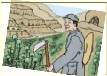
南泥湾“大生产运动”，实际上是非法种鸦片的运动。

却只在后方收编地方军和游击队，除了平型关等几个屈指可数的对日战斗外，共产党无抗日战绩可言，只是在忙于扩大地盘，在日本投降时抢着受降日军。 当时我的家乡属于沦陷区，中共叫“敌后”，八路军的一支部队在那驻扎七年，后来我成了其中的一员。在我入伍前后整整七年间，该部队没打过一次日本人。当时日本人就在城内，八路军在城外。后来，国民党部队一个旅开到当地，准备向日军开战。在国军立足未稳、毫无防备的情况下，突然被我所在的部队团团包围聚歼。激烈的战斗进行了一天一夜，国军的这支抗日部队整整一个旅全被消灭。 另外，中共大肆宣传的南泥湾“大生产运动”，实际上是非法种鸦片的运动。《九评》揭出了中共在陕北南泥湾种罂粟，战士张思德因烤制毒品被砸死这一史实。其实，种毒、制毒、贩毒的罪恶勾当在中共的各占领区蔓延普及，中共种植罂粟、制作毒品贩卖，换取经费以招兵买马，那是千真万确的事实。 当时我在部队的职责就是负责收购、发运毒