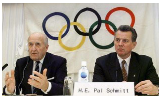
国际奥委会副主席、匈牙利奥委会主席 鲍尔·施密特先生（右）

【大纪元 11月29日讯】国际奥委会资深委员、欧洲议会议员，也是1968年及1972年击剑金牌得主匈牙利籍的鲍尔·施密特先生日前