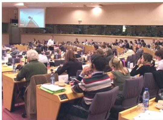
欧洲议会在布鲁塞尔举行中国人权听证

【明慧网】欧洲议会二零零七年十一月二十六日下午在布鲁塞尔举行中国人权听证。听证会由欧议会人权委员会主席依莲·弗劳特女士主持。两百多位各界人士参加了听证。依莲·弗劳特女士表示，人权委员会和整个欧洲议会会向中共当局施压，并采取必要的措施，在奥运前维护那里的人权。