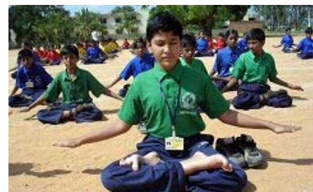
SRI K.V. 英语学校的学生 学炼第五套功法——神通加持

天气晴朗，艳光四射，有如台湾炎炎夏日一般，有些同修已经在流汗了。但是当炼功音乐响起后，学生神采奕奕随节奏炼功，由动作看来还满熟练的。炼功队伍中，有些学生姿势非常标