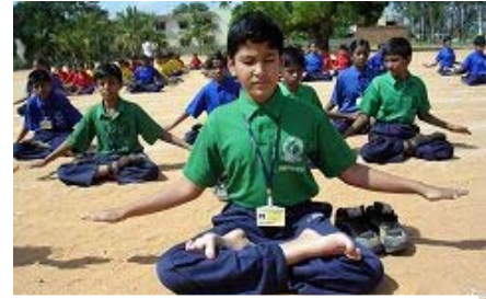
SRI K.V. 英语学校的学生 学炼第五套功法——神通加持

天气晴朗，艳光四射，有如台湾炎炎夏日一般，有些同修已经在流汗了。但是当炼功音乐响起后，学生神采奕奕随节奏炼功，由动作看来还满熟练的。炼功队伍中，有些学生姿势非常标