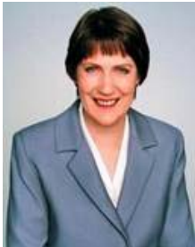
新西兰总理克拉克

在人权圣火到达新西兰之际，新西兰总理海伦·克拉克委托私人秘书散德拉·泰姆比亚于二零零七年十二月十三日回信给法轮功受迫害真相联合调查团，表达了对人权圣火传递活动的良好祝愿。即将在全国传递的人权圣火活动，在新西兰主流社会及不同种族社区间早已引起很大反响，很多社会名流及社团代表都将亲自参加活动以示支持，媒体对此也