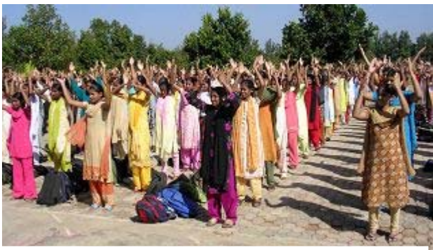
Sri Adichunchanagiri Mahasamsthama moth 学校的学生学炼法轮功

二零零七年十一月三十日清晨，我们为了到印度班加罗尔偏远乡村学校介绍法轮功，大伙起的早，用完早餐后，便搭车前往 Sri Adichunchanagiri Mahasamsthama moth 学校。