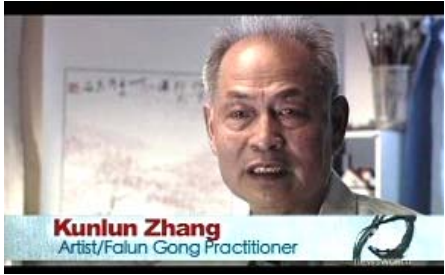
▲加拿大 CBC 电视台播放《超越红墙》