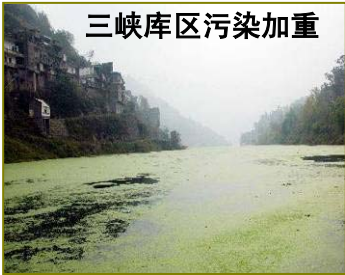
三峡库区污染加重