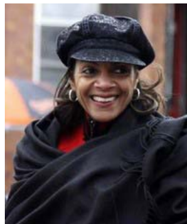
巴尔的摩市长指定神韵演出当日为巴尔的摩“圣诞晚会日”