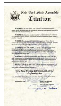
纽约州众议院褒奖