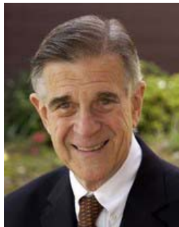
加州民主党国会议员致函新唐人电视台祝新年晚会成功