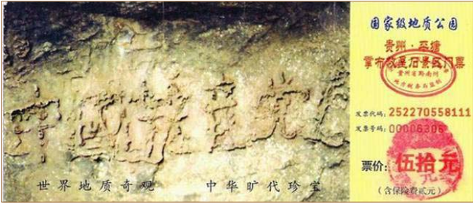
▲掌布风景区门票上“中国共产党亡”的照片

二零零二年六月，在贵州平塘县发现的亿年“藏字石”（下图），五百年前崩裂惊现“中国共产党亡”。这一切其实都是在告诉人们“天灭中共”的天象，希望人们能够“退党保平安”。