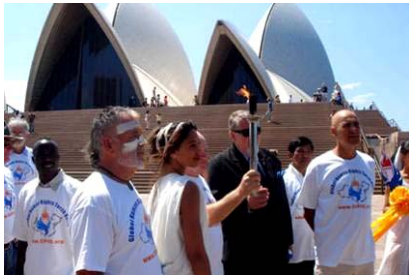
人权圣火经过澳洲悉尼歌剧院

二零零七年十月二十七日，人权圣火于上午十点左右到达澳洲悉尼市，多名澳洲政要、社区和人权团体的代表共同在悉尼市政厅前举行圣火迎接仪式，之后又在悉尼歌剧院附近的First Fleet 公园举行了欢迎仪式和文艺表演等活动，近千名澳洲民众参加了人权圣火的欢迎活动。欢迎活动吸引了十多家中英文媒体前来采访报道。