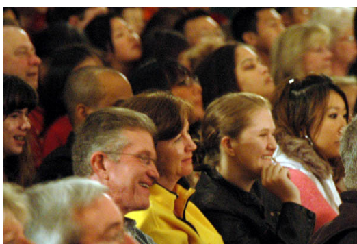
神韵晚会令观众陶醉其中

国际移民基金会主席爱德华先生说，这台晚会是一次真正完美的中国文化之旅，感受到真诚、善良、美好、积极、向上的心境，因此生出对中国传统文化的敬仰。