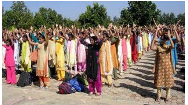
Sri Adichunchanagiri Mahasamsthama moth 学校的学生学炼法轮功

【明慧网】二零零七年十一月三十日清晨，我们为了到班加罗尔偏远乡村学校弘法，大伙起的早，用完早餐后，便搭车前往 Sri Adichunchanagiri Mahasamsthama moth 学校。