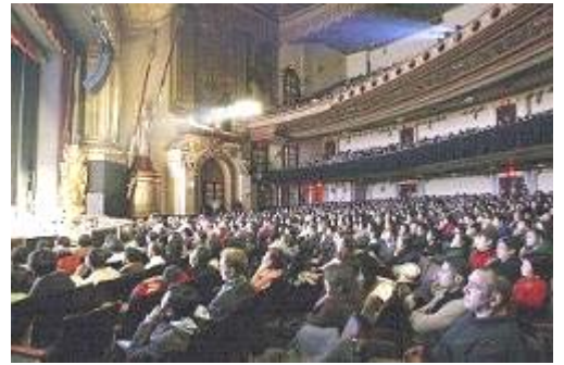
观众聚精会神的观看演出

很多现场观众赞叹，神韵艺术团的演出形神兼备，天人合一，通过生动刻画人物诠释中国文化的精神和美德，在举手投足间展现中国文化的韵味和意境，具有完美的艺术造诣和极强的生命感召力，令人回味无穷。