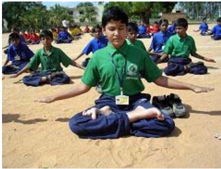
SRI K. V. 英语学校的学生 学炼第五套功法——神通加持法