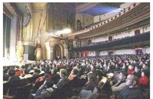
观众聚精会神的观看演出