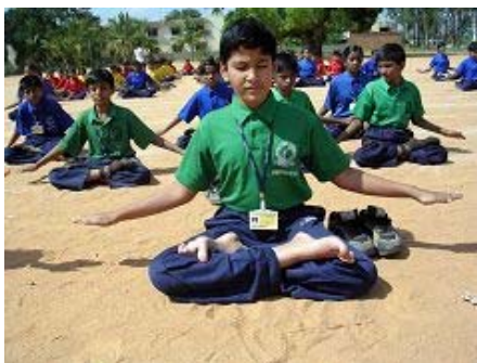
SRI K. V. 英语学校的学生 学炼第五套功法——神通加持法