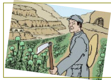
南泥湾“大生产运动”，实际上是非法种鸦片的运动。

来，国民党部队一个旅开到当地，准备向日军开战。在国军立足未稳、毫无防备的情况下，突然被我所在的部队团团包围聚歼。激烈的战斗进行了一天一夜，国军的这支抗日部队整整一个旅全被消灭。另外，中共大肆宣传的南泥湾“大生产运动”，实际上是非法种鸦片的运动。《九评》揭出了中共在陕北南泥湾种罂粟，战士张思德因烤制毒品被砸死这一史实。其实，种毒、制毒、贩毒的罪恶勾当在中共的各占领区蔓延普及，中共种植罂粟、制作毒品贩卖，换取经费以招兵买马，那是千真万确的事实。