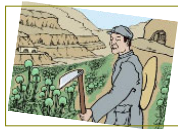
南泥湾“大生产运动”，实际上是非法种鸦片的运动。

来，国民党部队一个旅开到当地，准备向日军开战。在国军立足未稳、毫无防备的情况下，突然被我所在的部队团团包围聚歼。激烈的战斗进行了一天一夜，国军的这支抗日部队整整一个旅全被消灭。另外，中共大肆宣传的南泥湾“大生产运动”，实际上是非法种鸦片的运动。《九评》揭出了中共在陕北南泥湾种罂粟，战士张思德因烤制毒品被砸死这一史实。其实，种毒、制毒、贩毒的罪恶勾当在中共的各占领区蔓延普及，中共种植罂粟、制作毒品贩卖，换取经费以招兵买马，那是千真万确的事实。