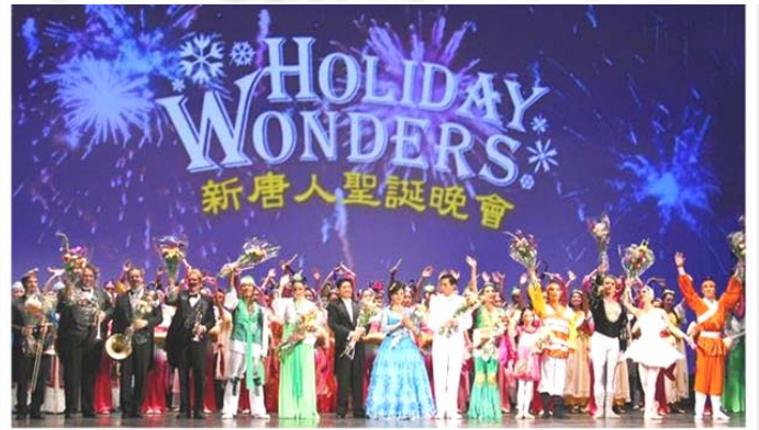
2007年由神韵艺术团担纲的新唐人圣诞晚会，