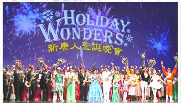
2007年由神韵艺术团担纲的新唐人圣诞晚会，