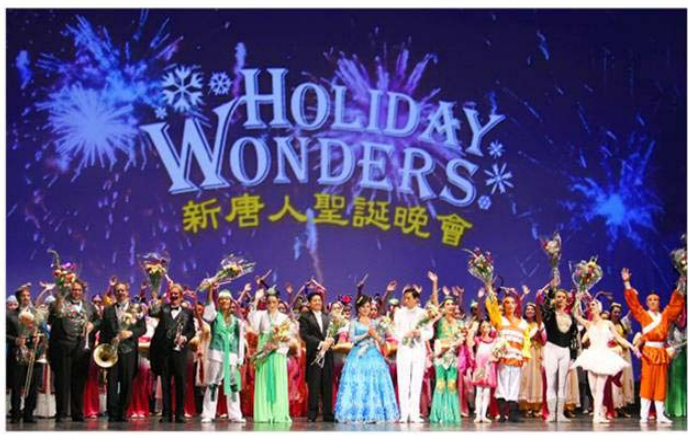
由神韵艺术团担纲的新唐人圣诞晚会，12月18

变了对我的态度，并且将我和孩子也带上了修炼之路。他白天做生意，晚上一家人在一起炼功，再也不用担心他去约会了。通过在大法中修炼，全家人身体健康了，丈夫行为端正了，威信也高了，现在活的轻松自在。