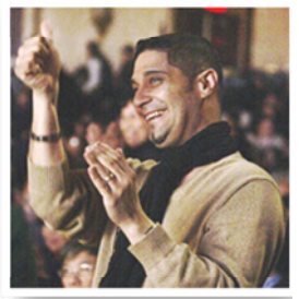
纽约百老汇现场观众