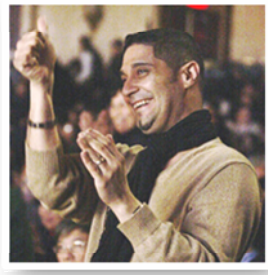
纽约百老汇现场观众