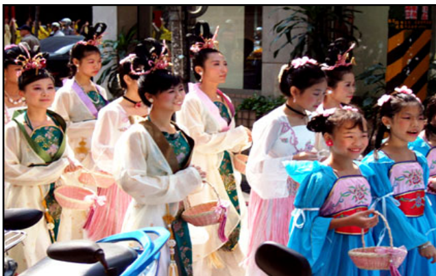
高洁端雅、手提花篮的仙女队伍

在游行过程中，除了队伍整齐，节奏欢庆，传承了传统文化意涵的腰鼓队伍得到普遍的注目外，更让市民瞪大了眼啧啧称奇的，还有这群美丽可爱的仙女们；只见她们个个手提花篮，笑脸迎人的将手中莲花递送给路边行人，让所有拿到莲花书签的民众都雀跃不已。