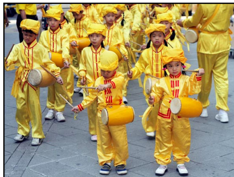
来自明慧学校的娃娃天使

游行，大家一起来造势助阵。明慧学校的法轮大法小弟子，则以清丽仙女与英气勃发的腰鼓队，参与这热闹有意义的活动！