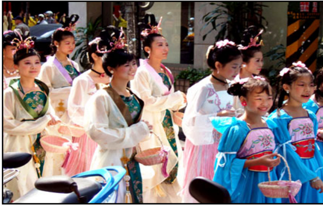
高洁端雅、手提花篮的仙女队伍

在游行过程中，除了队伍整齐，节奏欢庆，传承了传统文化意涵的腰鼓队伍得到普遍的注目外，更让市民瞪大了眼啧啧称奇的，还有这群美丽可爱的仙女们；只见她们个个手提花篮，笑脸迎人的将手中莲花递送给路边行人，让所有拿到莲花书签的民众都雀跃不已。