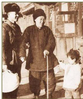
图：扶老携幼，还有随身摄影师抓拍精彩瞬间，真是“好人”有“好事”啊。

雷锋做好事，是他发自人本性善良的表现。但在共产党的宣传里，雷锋被宣传成“高大全”、被利用来