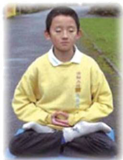
上图：小时候的阳阳在打坐炼功