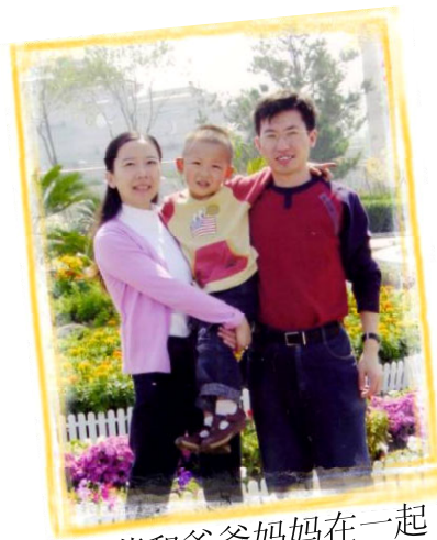
蓬蓬和爸爸妈妈在一起

蓬蓬今年六周岁了，上小学一年级，家住大连。蓬蓬说他的最大心愿就是：“我和爸爸妈妈三个人能永远在一起，警察不要抓走爸爸妈妈！”