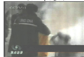
3、手摸被打后的头部