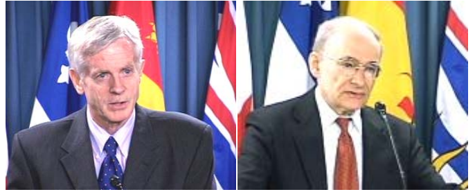
加拿大调查员大卫·乔高 和 大卫·麦塔斯