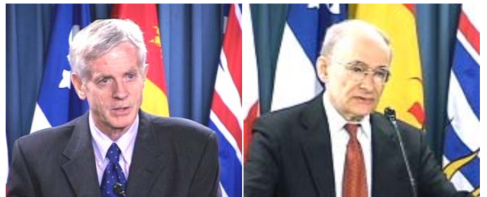
加拿大调查员大卫·乔高 和 大卫·麦塔斯