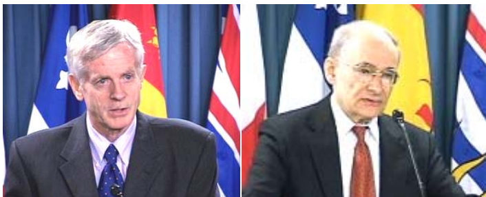
加拿大调查员大卫·乔高 和 大卫·麦塔斯

【明慧网】经过近半年的继续深入调查，加拿大调查员大卫·麦塔斯和大卫·乔高收集到更多确认中共