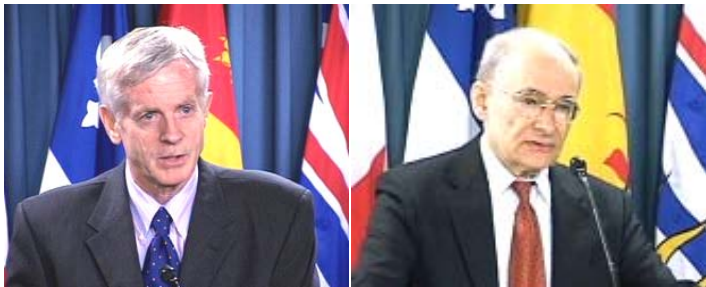
加拿大调查员大卫·乔高 和 大卫·麦塔斯

【明慧网】经过近半年的继续深入调查，加拿大调查员大卫·麦塔斯和大卫·乔高收集到更多确认中共