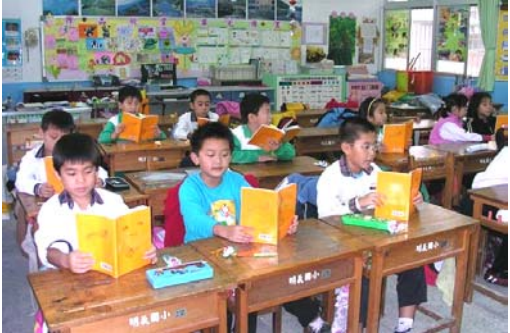
明慧组的孩子们在读《洪吟》