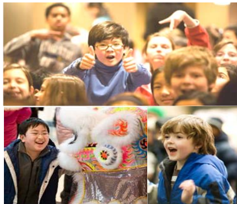
▲精彩的节目让孩子们兴奋不已

孩子们的阵阵欢呼雀跃中，二零零七年新唐人全球华人新年晚会总第十二场于一月十九日下午两点在多伦多艺术中心上演。现场一千七百多名学生、家长和老师感受到了中国传统文化的魅力。