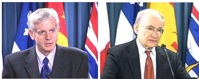
加拿大调查员大卫·麦塔斯和大卫·乔高

渥太华国会公布了修订后的报告《血腥的活摘器官——加拿大关于中共活取法轮功学员器官调查报告》。增补后的报告将原有的十八种论证方法扩充到三十三种。