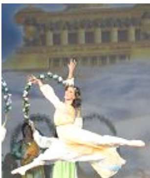
▲舞蹈《誓约》：慈悲的神立誓下世救人，为人类有得救的机会而欢庆。

以展现中华神传文化为主题的第四届“新唐人全球华人新年晚会”二零零七年在世界三十个大城市上演，节目精彩绝伦，展现的慈悲、纯正、沁人心脾的力量撼动着观众的心。