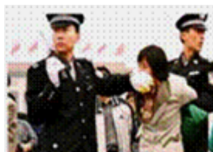
人们说真话的权利被剥夺

《九评共产党》一书深刻揭露了中共邪恶本质，到2007年2月16日已有超过1857万中国民众在海外大纪元网站声明退出中共党、团、队。其中包括中共党政军高层内的党员。