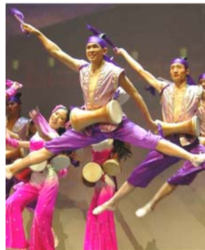
飞天舞蹈学校的学生在新唐人新年晚会上表演《鼓韵》

飞天舞蹈学校不仅仅是培养跳舞技能，更是在道德、礼仪、传统文化、艺术欣赏等方面进行