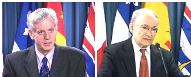
加拿大调查员大卫·乔高 和 大卫·麦塔斯