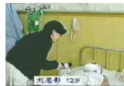
中央台“天安门自焚案”中的“烧伤病人”身体被严密包裹

鼻而来。我急忙找来医生,医生处理好伤口后,再三嘱咐不能让苍蝇落上伤口,以防感染。