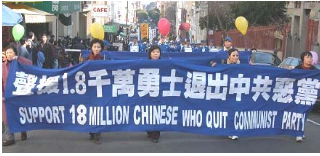
美国旧金山市游行声援1800万人退出中共党、团、队