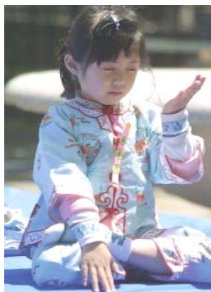
图片赏析——纯 一名儿童正 在炼法轮功第五套功法—— 神通加持法。