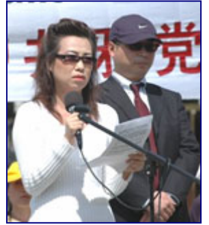
两位揭露苏家屯集中营摘取活体法轮功学员器官牟利的关键证人在Mcpherson公园公开现身，表达对中共加紧销毁证据，欺骗世界舆论的愤怒。

99年7-20以来，明慧网曝光有3000多名真名实姓的法轮功学员被迫害致死；2006年3月两位证人现身揭露在沈阳苏家屯秘密集中营活体摘取法轮功学员器官移植以牟暴利；后又有沈阳老军医曝光这样的集中营在全国至少有36个，而且全是实行军事管制，就是说整个国家的军队和军事设施甚至大量的医院都在被中共利用、操纵着进行杀人犯罪；白衣天使的使命是救死扶伤。但在邪恶中共的欺骗毒害下，许多人已沦为恶党的杀人工具，自觉地干了违背天理良心的事情。