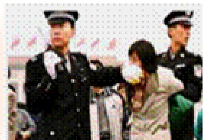
人们说真话的权利被剥夺了

1999年7月起，江泽民与中共相互利用，全面公开打压法轮功。七年来面对残酷迫害，法轮功修炼者没有被压倒，面对铁窗和酷刑，是隐忍偷安？还是揭竿而起？都不是。法轮功学员选择的是和平理性地、意志如钢地坚守着“真善忍”的信念。揭露被中共造谣歪曲、掩盖的事实，将法轮功真相传遍世界。