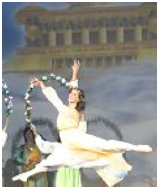
▲舞蹈《誓约》：慈悲的神立誓下世救人，为人类有得救的机会而欢庆。

以展现中华神传文化为主题的第四届“新唐人全球华人新年晚会”二零零七年在世界三十个大城市上演，节目精彩绝伦，展现的慈悲、纯正、沁人心脾的力量撼动着观众的心。