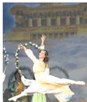
▲舞蹈《誓约》：慈悲的神立誓下世救人，为人类有得救的机会而欢庆。

著名女低音歌唱家杨建生演唱的歌曲之一《天安门广场，请你告诉我》，触动很多观众的内心深处，人对神传文化的直接感受，语言已不是障碍，每场都有观众听后起立鼓掌，东西方观众感动的落泪。