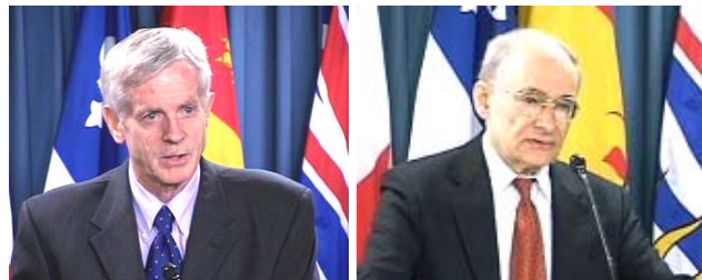
加拿大调查员大卫·乔高 和 大卫·麦塔斯