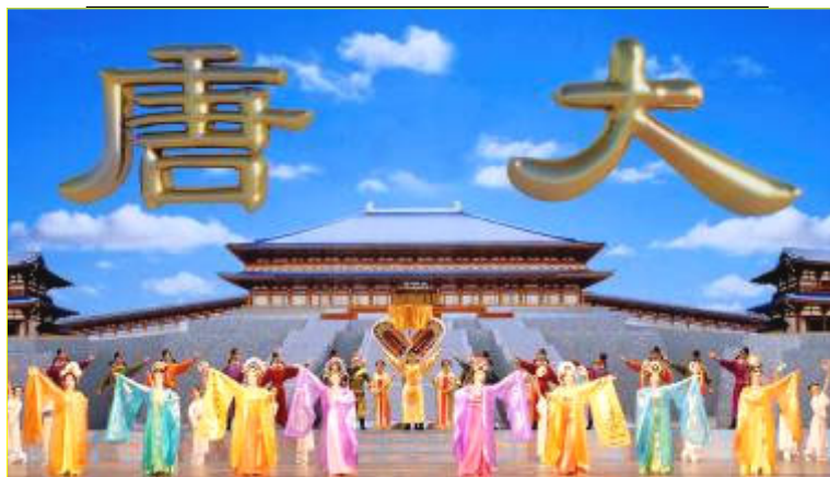
▲全球华人新年晚会美国纽约首场大型舞蹈《创世》剧照