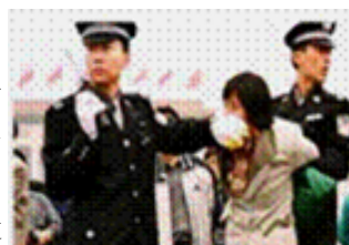
人们说真话的权利被剥夺了

1999 年 7 月起，江泽民与中共相互利用，全面公开打压法轮功。七年来面对残酷迫害，法轮功修炼者没有被压倒，面对铁窗和酷刑，是隐忍偷安？还是揭竿而起？都不是。法轮功学员选择的是和平理性地、意志如钢地坚守着“真善忍”的信念。揭露被中共造谣歪曲、掩盖的事实，将法轮功真相传遍世界。