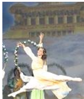
▲舞蹈《誓约》：慈悲的神立誓下世救人，为人类有得救的机会而欢庆。

著名女低音歌唱家杨建生演唱的歌曲之一《天安门广场，请你告诉我》，触动很多观众的内心深处，人对神传文化的直接感受，语言已不是障碍，每场都有观众听后起立鼓掌，东西方观众感动的落泪。