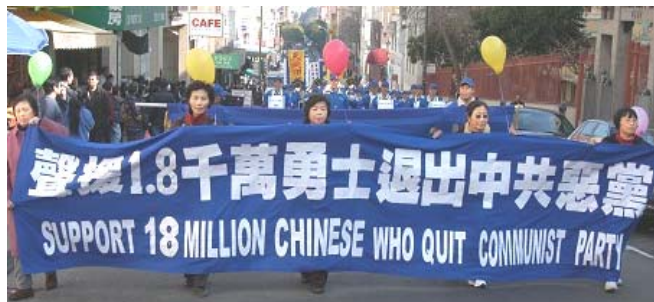
美国旧金山市游行声援 1800 万 人退出中共党、团、队

年 2 月 25 日已有超过 1891 万 中国民众在海外大纪元网站声明退出中共党、团、队。其中包括中共党政军高层内的党员。