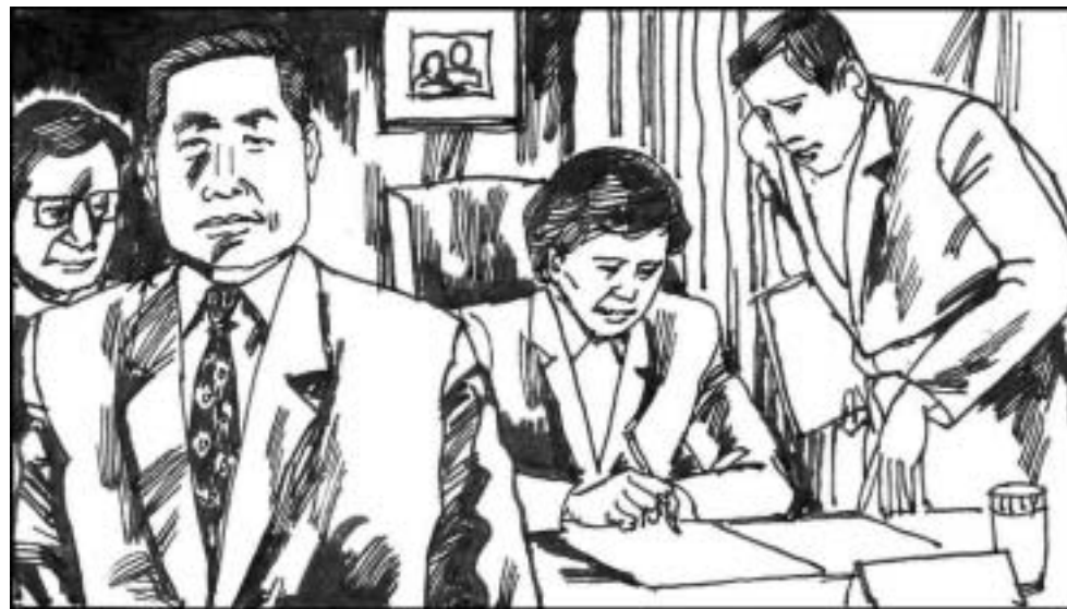
14. 远华案的另一个主要人物是江泽民的亲信贾庆林，时任福建省委书记和福建省人大常委会主任，他的太太林幼芳在中国外贸集团福建省总公司任党委书记，与远华撇不清关系。