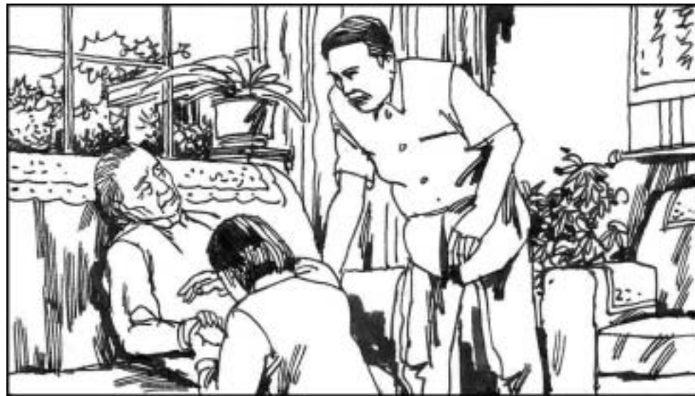
10. 姬胜德母亲许寒冰通过元老与遗孀路线为儿子争得死缓。江泽民拒绝了姬胜德保外就医的要求，还不准他母亲定期探望。许悲愤难抑，吞安眠药自杀被抢救了过来。