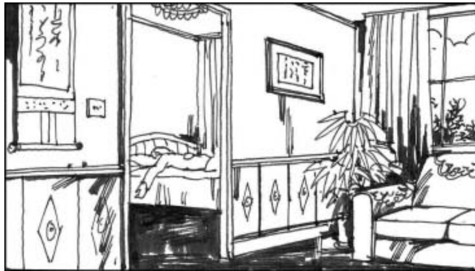
8. 正在北京香山养老的姬鹏飞曾先后四次写信给江泽民等请求宽恕独子姬胜德，免其一死，但遭到拒绝。姬鹏飞绝望之下于 2000 年 2 月 10 日 13 时 52 分服安眠药自杀身亡。