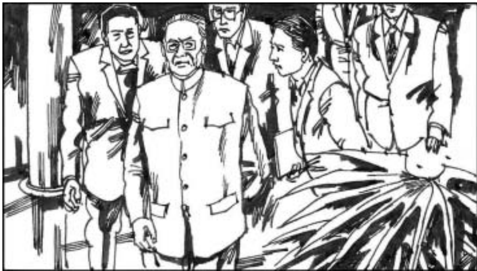
5. 姬鹏飞曾是中共外事系统实权派，也曾是接管香港的首脑人物。历任国务院副总理、国务委员、港澳办主任、人大副委员长、中顾委常委，权高位重。