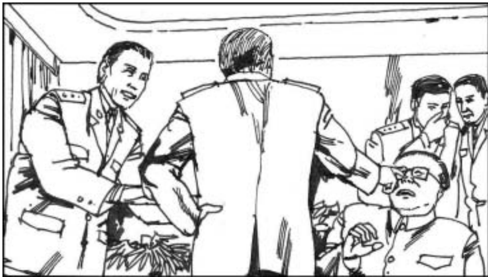
11. 刘华清是邓小平给江泽民在军委里找的保姆。刘华清在政治局会议上经常指着江泽民的鼻子教训他，乱提拔将军的江当然不肯要人整天给他做什么指导。