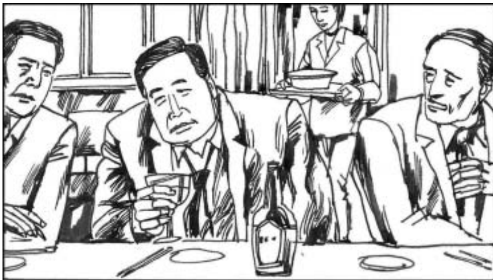
17. 北京市委欢送市委书记贾庆林晋升的宴会上，贾闷头一杯杯地灌五粮液嘟囔着：“不是我贾庆林要高升……”直到醉倒。在十六大会议上，贾庆林坐在主席台上愁眉苦脸，做了江家帮就身不由己。