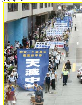
▲“天灭中共”大幡 在香港九龙闹市区

我们某某派出所的全体共产党员在二零零七年元旦之际向全世界郑重声明：全部退出中国共产党，并与