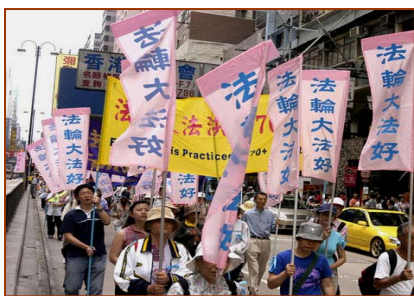
▲香港“法轮大法好”彩旗飘扬