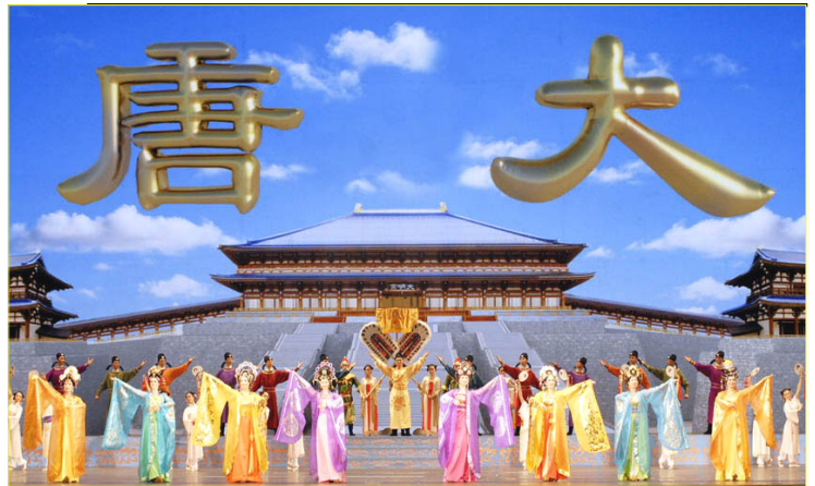
▲全球华人新年晚会纽约首场大型舞蹈《创世》剧照