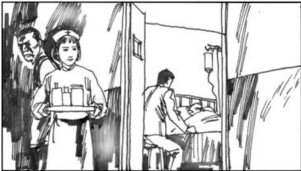
9. 江泽民特别“关心”的解放军总医院很快就被派上了用场。1998 秋，杨尚昆得了感冒，住进了完全被江泽民和曾庆红控制的解放军总医院。