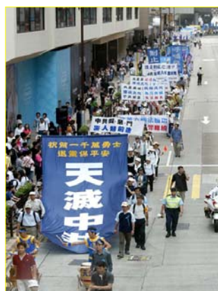
▲“天灭中共”大幡在香港九龙闹市区

在国内，我们也偶尔得一些法轮功的真相资料，可不象今天这么多、这么齐：“大纪元”报人手一份，