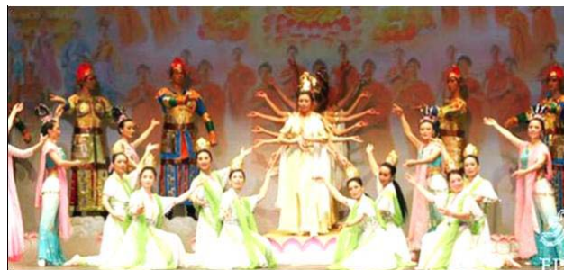
▲舞蹈《归位》讲述千古不变的善恶有报真理

【明慧网】以展现中华神传文化为主题的第四届“新唐人全球华人新年晚会”二零零七年在世界三十个大城市上演，节目精彩绝伦，展现的慈悲、纯正、沁人心脾的力量撼动着观众的心。