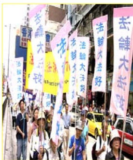
香港“法轮大法好”彩旗飘扬

万没想到在将离开香港时，中国导游突然对大家说：“各位游客，请将你们得到的法轮功宣传品一张不留的全交出来扔到垃圾箱里，否则上飞机搜查出一张，坐牢七天，罚款五千元，由原单位出证明方可取保。”