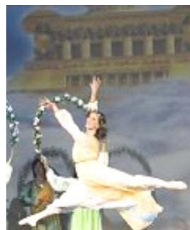
▲舞蹈《誓约》：慈悲的神立誓下世救人，为人类有得救的机会而欢庆。

西方观众为中华神传文化敬天知命忠孝节义等丰富内涵折服。华人观众则对中国正统文化的弘扬世界而倍感骄傲。联邦政府雇员特尼沙·威廉姆说节目“誓约”深深打