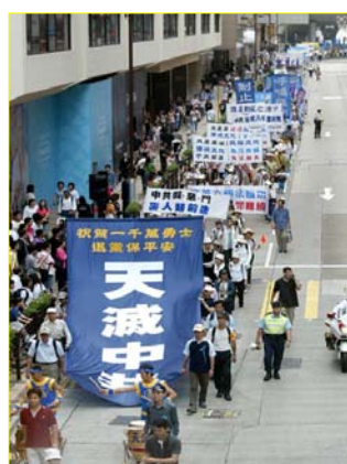
▲“天灭中共”大幡在香港九龙闹市区

在国内，我们也偶尔得一些法轮功的真相资料，可不象今天这么多、这么齐：“大纪元”报人手一份，