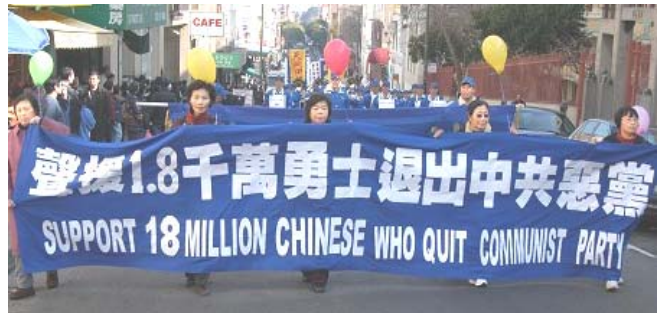
美国旧金山市集会游行声援 1800 万中国人退出中共党、团、队

《九评共产党》一书深刻揭露了中共邪恶本质，已在中国促成强大的退出中共恶党的大潮，到 2007 年 2 月 5 日已有超过 1821 万中国民众在海外大纪元网站声明退出中共党、团、队。其中包括中共党政军高层内的党员。