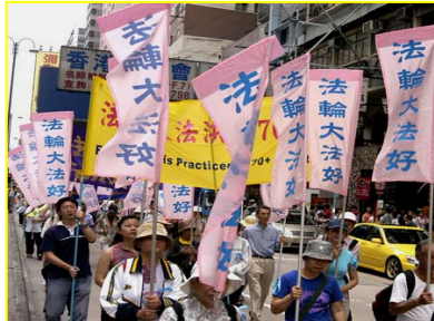
香港“法轮大法好”彩旗飘扬

在国内，我们也偶尔得一些法轮功的真相资料，可不象今天这么多、这么齐：“大纪元”报人手一份，还有小册子、“九评”、“解体党文化”、光碟、及其它的资料等等。有的资料是大家在国内闻所未闻、见所未见的，一个个都爱不释手。