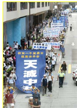
▲“天灭中共”大幡在香港九龙闹市区

对来自社会各界人士的新年问候，法轮功创始人在新年的第一天在明慧网发表文章，如下：