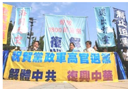
“解体中共”大幡在香港闹市区

万没想到在将离开香港时，中国导游突然对大家说：“各位游客，请将你们得到的法轮功宣传品一张不留的扔到垃圾箱里，否则上飞机搜查出一张，坐牢七天，罚款五千元，由原单位出证明方可取保。”我们都大吃一惊，不约而同的问：“为