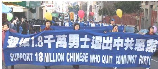
美国旧金山市游行声援 1800 万人退出中共党、团、队

《九评共产党》一书深刻揭露了中共邪恶本质，已在中国促成强大的退出中共恶党的大潮，到 2007 年 2 月 6 日已有超过 1824 万中国民众在海外大纪元网站声明退出中共党、团、队。其中包括中共党政军高层内的党员。