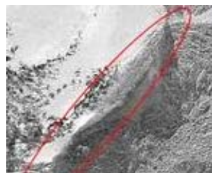
快鸟商用遥感卫星 2003 年拍摄的亚拉拉特山船形“不规则区域”照片

1883 年，一次大地震使亚拉拉特山的一个地段裂开了一道大口，突然露出了一条高十几米的大船！当时赴地震灾区考察委员会的所有成员都看到了这条船露出冰山的部分。这个消息使寻舟的热潮席卷全球。