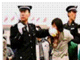
人们说真话的权利被剥

《九评共产党》一书深刻揭露了中共邪恶本质，到 2007 年 2 月 8 日已有超过 1833 万中国民众在海外大纪元网站声明退出中共党、团、队。其中包括中共党政军高层内的党员。