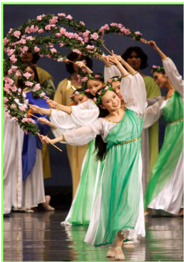
▲舞蹈《誓约》。慈悲的神立誓下世救人，并为人类有得救的机会而欢庆。

一位七十多岁的老华侨为看晚会不惜辗转到达旧金山。他说，每个节目都太美、太正了；他边看边流泪。老人知道很多法轮功学员参与了晚会演出和创作，他感慨的说：“他们所做都是无私付出，不是为了名利和钱，而是真正的为了中国人。”