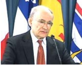
加拿大调查员大卫·乔高 和 大卫·麦塔斯