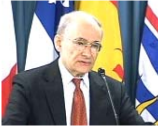
加拿大调查员大卫·乔高 和 大卫·麦塔斯