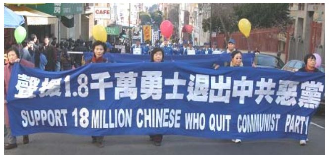
美国旧金山市游行声援 1800 万人退出中共党、团、队

《九评共产党》一书深刻揭露了中共邪恶本质，已在中国促成强大的退出中共恶党的大潮，到 2007 年 2 月 9 日已有超过 1833 万中国民众在海外大纪元网站声明退出中共党、团、队。其中包括中共党政军高层内的党员。