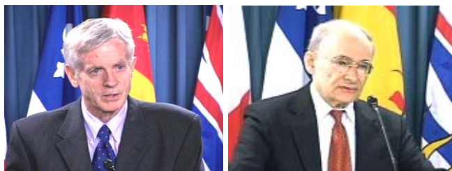
▲加拿大调查员大卫·乔高 和 大卫·麦塔斯

【明慧网】二零零七年一月三十一日，两位加拿大调查员发布调查报告增补版，加入更多直接证据显示活体摘取法轮功学员器官遍布全中国。