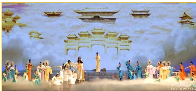
《创世》：慈悲的主佛率众神佛下世，为苍宇众生开创美好的未来。

二月十七日中国新年除夕夜，新唐人“全球华人新年晚会”在纽约“无线电音乐城”的演出达到高潮，这台世界一流水平的至纯、至善、至