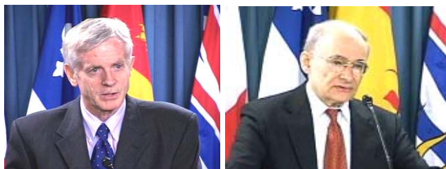
▲加拿大调查员大卫·乔高 和 大卫·麦塔斯

【明慧网】二零零七年一月三十一日，两位加拿大调查员发布调查报告增补版，加入更多直接证据显示活体摘取法轮功学员器官遍布全中国。