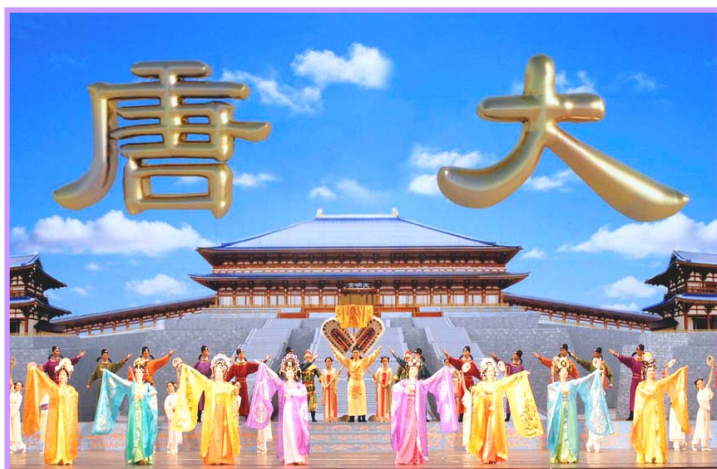
▲全球华人新年晚会纽约首场大型舞蹈《创世》剧照

从中国大陆出来的夏先生很受触动。他说，我从大陆出来，比较了解大陆的情况，有信仰的法轮功学员都是善意的，他们从中受益，这就是为什么炼的人越来越多，政府（中共）连这么一点信仰自由都不给。其实中国人心里都清楚什么是正义的。