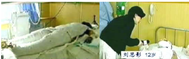
央视《焦点访谈》中的“自焚者”被包裹得严密。