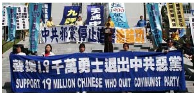
三月三日美国洛杉矶民众集会游行庆祝一千九百万中国人退出中共党、团、队

记者评论说，“晚会呈现给观众的不仅是壮观的演出，而且还肩负着一个（高尚的）使命——升华人们的心灵。”“晚会是复兴正统的中国传统文化，全方位展现中国传统文化的美好、博大和邃。”