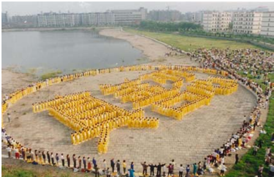
1998 年武汉法轮功学员大型排字炼功

调查结果显示，炼功后学员的身体变化十分明显，学员节省医疗费的情况也非常显著：有 95.51% 的学员因在修炼后达到身心健康，疾病消失率为 75.15%，好转率为 23.3%。对吸烟、饮酒和赌博等个人不良嗜好的调查结果显示：修炼前吸烟者有 377 人，修炼后仍吸烟者为 3 人，吸烟减少者为 8 人；修炼前饮酒者有 536 人，修炼后仍饮酒者为 3 人，酒量减少者为 7 人；修炼前赌博者有 420 人，修炼后仍赌博者为 1 人，次数减少者为 10 人。