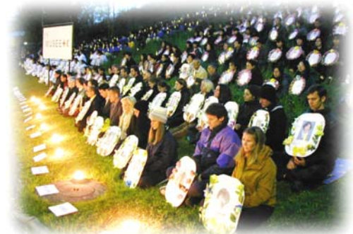
▲法轮功学员在日内瓦人权会议期间举行烛光守夜悼念被迫害致死的法轮功学员

中共用利益收买媒体，让许多媒体面对中共的反人类罪恶噤声，甚至为中共传播谎言。而法轮功学员创办报纸电视台，才使法轮功的真相得以传播，才使中共迫害法轮功的暴行特别是活体摘取法轮功学员器官并焚尸的前所未有的邪恶得以在全世界曝