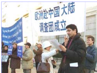
真相调查团欧洲分团二月三日在伦敦中使馆前举行新闻发布会，宣布正式成立。

二零零七年二月十二日，法轮功受迫害真相联合调查团（CIPFG）已经完成在全球四大洲的初步组建工作，四个调查分团已相继成立。他们是：澳洲调查分团，亚洲调查分团，欧洲调查分团和美国一加拿大调查分团。