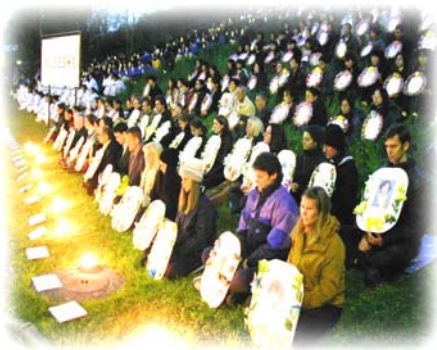
▲法轮功学员在日内瓦人权会议期间举行烛光守夜悼念被迫害致死的学员

在快八年的反迫害中，法轮功学员们所做的不过就是要讲清真相，揭露中共，制止迫害。法轮功学员没有政治目的，而且修炼者是要放弃对人间权力的执著的。我们看到，中共的“搞政治”论让人们默认和盲目附和中共对善良民众的打压和诽谤，也成为人们了解法轮功真相的巨大障碍。《九评共产党》清晰的揭示了共产党的邪恶本质，因之所掀起的退党大潮，能使人们退出中共的“政