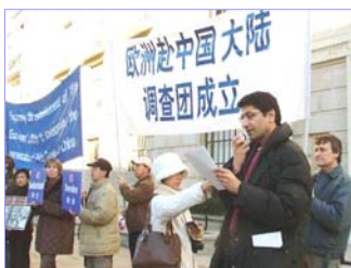
真相调查团欧洲分团二月三日在伦敦中使馆前举行新闻发布会，宣布正式成立。

二零零七年二月十二日，法轮功受迫害真相联合调查团（CIPFG）已经完成在全球四大洲的初步组建工作，四个调查分团已相继成立。他们是：澳洲调查分团，亚洲调查分团，欧洲调查分团和美国一加拿大调查分团。