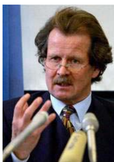
二零零五年十二月，联合国酷刑问题专员诺瓦克先生在新闻发布会上谴责中共滥用酷刑。

关于中共卫生部副部长黄洁夫表示器官来源于死刑犯自愿捐献的说法，诺瓦克说，“我们不知道中国有多少人被处以死刑，因为中国是唯一一个不公开这方面数据的国家。根据来自非政府组织，如