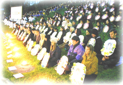
▲法轮功学员在日内瓦人权会议期间举行烛光守夜悼念被迫害致死的法轮功学员

“搞政治”真的那么可怕吗？大家看到，正是法轮功学员们和他们的支持者们不断的呼吁，在全世界范围内的和平请愿、抗议和讲清真相，起诉犯罪元凶，才有力的抑制了中共的残暴。中共用利益收买媒体，让许多媒体面对中共的反人类罪恶噤声，甚至为中共传播谎言。而法轮功学员创办报纸电视台，才使法轮功的真相得以传播，才使中共迫害法轮功的暴行特别是活体摘取法轮功学员器官并焚尸的前所未有的邪恶得以在全世界曝光，才有有效的遏制了中共的肆意妄行。